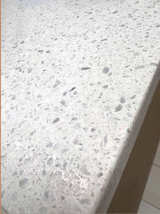
樹脂系研ぎ出し材