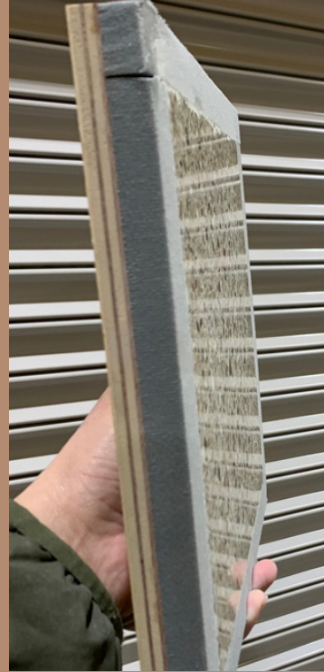
か数オリジナルセメント系研ぎ出し材

メーカーから販売されている樹脂系研ぎ出し材と、か数オリジナルセメント系研ぎ出し材では審美的な違いはほとんどありません。強度は、樹脂系研ぎ出し材に比べ割れやすくなりますが、メリットとしては、施工単価が安くなります。