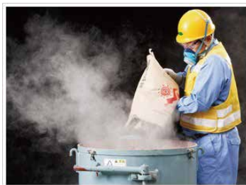
普通ポルトランドセメント