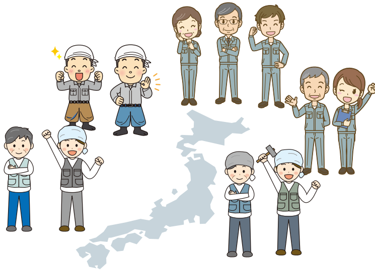
協力会社のネットワーク体制

あらゆる地域で協力会社を備えており、 また、大面積の工事にも対応できる体制を整えております。